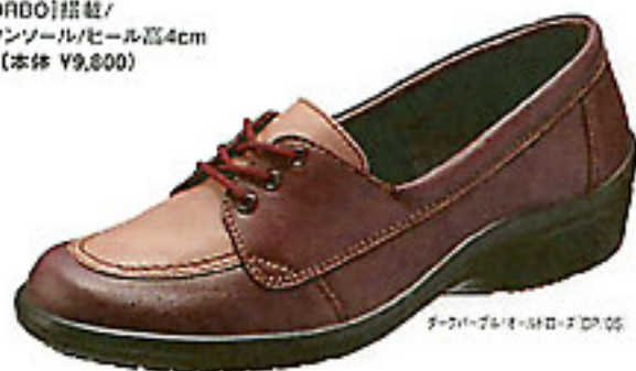
アッパー：本革/ヒール高4cm

・サイズ/22.0~25.0cm 3E ゆったり設計 ・アッパー：本革 ・踵部[SORBO]搭載/ ポリウレタンソール/ヒール高4cm ¥10,290 (本体 ¥9,800)