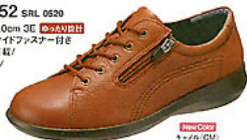
New Color 1+26(CM)

・サイズ/22.0~25.0cm 3E ゆったり設計 ・アッパー：本革 ・サイドファスナー付き ・踵部[SORBO]搭載/ ポリウレタンソール/ ヒール高3cm ¥12,600 (本体 ¥12,000)